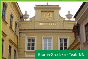
Brama Grodzka - Teatr NN