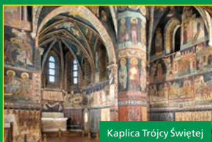
Kaplica Trójcy Świętej

Powyższe informacje zostały przygotowane w konsultacji z Miastem Gospodarzem. | The above information was prepared in consultation with the Host City.