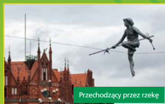
Przechodzący przez rzekę