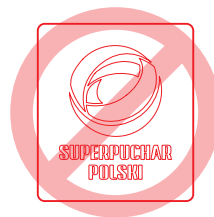
zmiana ułożenia sygnetu i podpisu