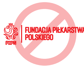
zmiana ułożenia sygnetu i podpisu